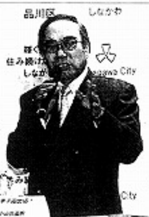
品川区長 田中 隆一 氏

品川区は十二日、総額千四百六十二億円（前年度比9・8%増）の新年度一般会計予算案を発表した。当初予算案の金額では過去最大、へりポートのある防災拠点の整備のため、しながわ中央公園（西品川）の拡張に着手するほか、六年後の五輪に向け小中学校の英語教育を充実する。