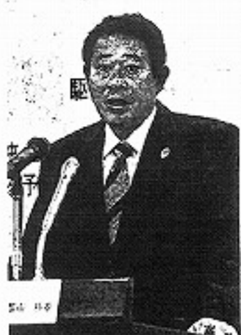
新年度予算案を発表する 田中良区長＝杉並区で

で五百八十八人分の定員拡大を図る。区は待機児童ゼロを目指しており、田中良区長は「補