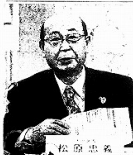
松原忠義 新年度予算案を説明する 松原忠義区長＝大田区で