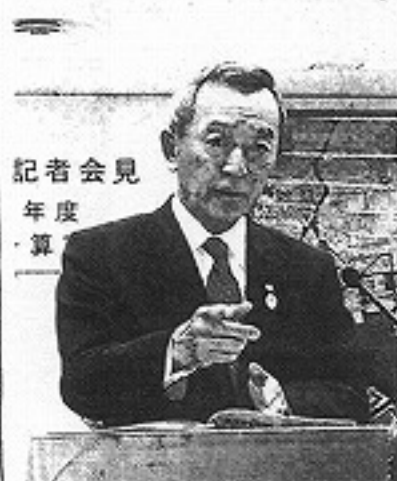
記者会見 年度 予算