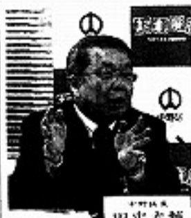
新年度予算案を説明する田中大輔区長＝中野区で