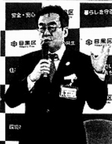
新年度当初予算案を発表する青木英二区長＝目黒区で