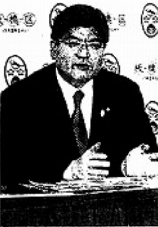
新年度予算案を発表する板本健区長＝板橋区で