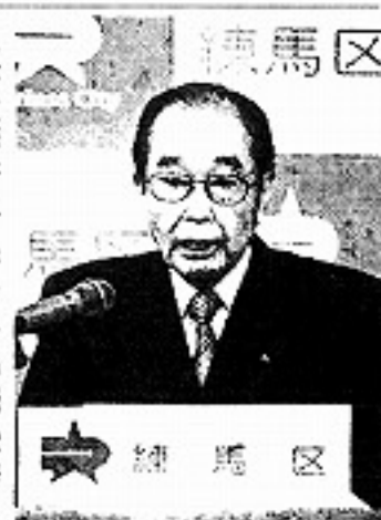
2014年度当初予算案を発表する練馬区の志村豊志郎区長。同区役所で。

練馬区は二十九日、一般会計の総額が二千三百九十一億円（前年度比3.1%増）の新年度予算案を発表した。