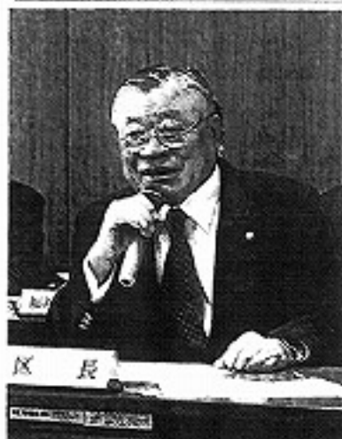
新年度予算案を発表する多田正見区長＝江戸川区で