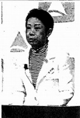
新年度予算案を発表する近藤弥生区長＝足立区で

足立区は三十日、総額二千五百六十四億円（前年度比0・9%減）の新年度一般会計予算案を発表した。小学生の学力向上や防災対策に力を入れるほか、区の福祉部を再編し、二十三区最多の生